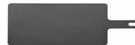
45,7 x 19