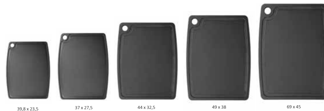
39,8 x 23,5 37 x 27,5 44 x 32,5 49 x 38 69 x 45

Il profilo più spesso dei taglieri della serie "Gourmet Professional" offre lo spazio sufficiente per una generosa scanalatura su un lato per raccogliere i liquidi e mantenere pulito il piano di lavoro. Ideale per carne, pesce, frutta e verdura. In cinque pratiche misure.