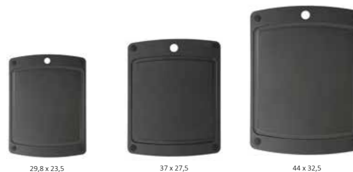
29,8 x 23,5 37 x 27,5 44 x 32,5

Le migliori caratteristiche di tutti i nostri taglieri sono combinate in questa serie: piedini antiscivolo, una generosa scanalatura per la raccolta dei liquidi su un lato, il solito profilo sottile e un peso piacevole. Ideale per carne, pesce, frutta e verdura. Il tutto nelle tre taglie più gettonate.